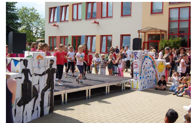
Unsere erworbene Bühne für die Auftritte bei Schulevents

Mit Aufdrucken und Planen werben wir für unsere Grundschule