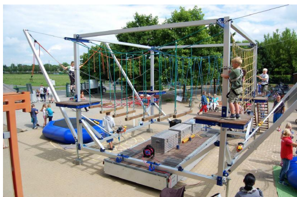
Gestellter Kletterparcour für das Schulfest