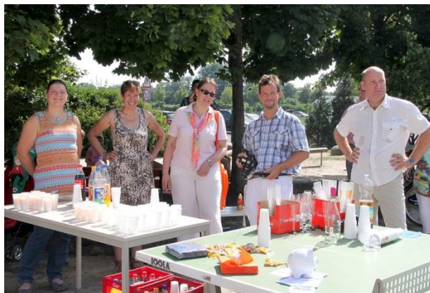
Erfrischungsteam ☺ bei der Einschulung